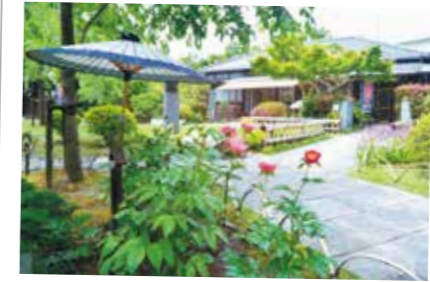
32 庭園と屋敷林が調和する 抹茶亭

かつて抹茶を作っていた場所で、一年を通して四季を感じる様々なイベントが催されています。