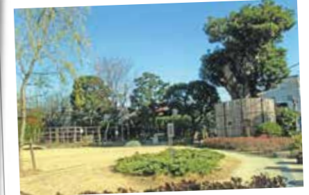
123 学び場の記憶 一之江分教場の杜

かつて抹茶を作っていた場所で、一年を通して四季を感じる様々なイベントが催されています。