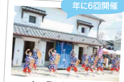
125 江戸情緒溢れる にぎわいの拠点 新川さくら館

一之江駅前西口秋イルミネーションミュージックねぶた祭りではゴスペルのライブなどが行われ、葛西工業高校の「ねぶた」がまちを練り歩きます。