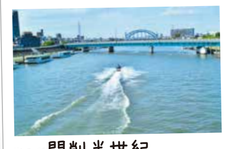
75 開削半世紀 すっかり馴染んだ新中川

昭和16年から整備が始められ、昭和38年の今井水門の完成により新中川が生まれました。