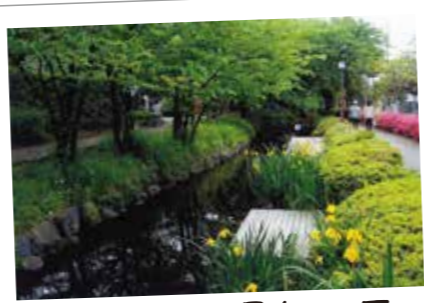
22 全国初の景観地区 一之江境川親水公園

昭和11年に東小松川で創業した伝統の工房。かつては一之江境川で「洗いの工程」を行っていました。