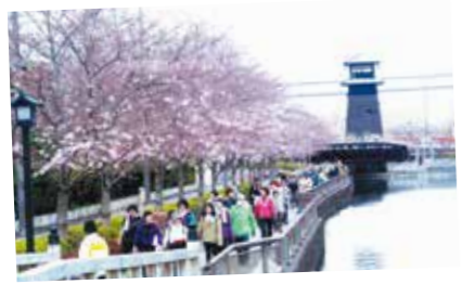
47 新名所 新川千本桜と火の見櫓

全長3kmの新川は江戸情緒あふれる街並みとして整備され、春には20種の桜が咲き誇ります。