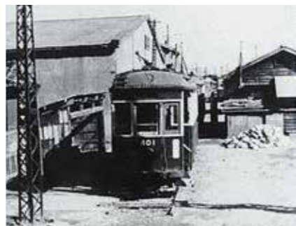
城東電車 <東荒川停留所(現・西小松川町)>

平井の渡しから今井の渡しを結ぶ行徳道(現在の今井街道)は、江戸時代から元佐倉道と並んで江戸川区域を東西に横断する重要な路線で、成田山や浅草観音への参詣路にも利用されました。明治時代になると行徳街道と呼ばれるようになり、大正14年からは行徳街道の南側に平行して城東電車が開通、車輛が一両で「マッチ箱電車」と呼ばれていました。昭和27年には架線からの電気で走るトロリーバスに代わり、上野公園と今井を結んでいましたが、自動車の普及に押されて昭和43年に廃止となり、路線バスの運行となりました。一之江境川親水公園と今井街道が交わるあたりでは、当時を思わせる軌道跡のモニュメントや城東電車・トロリーバスのブロンズ模型を見ることができます。