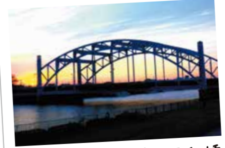
115 風格ある門構え 明和橋

大正から昭和にかけて一之江地区の低学年児童が通う分教場があった場所が、公園として整備されています。