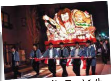
36 区画整理で誕生 一之江駅西口広場

普段見ることのできない伝統工芸者の実演も行われ、熟練した技を見ることが出来ます。