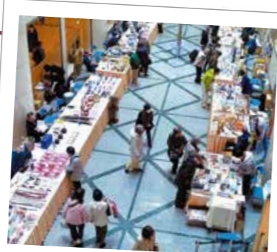
31 枝の競演 子らに伝える 伝統工芸展

普段見ることのできない伝統工芸者の実演も行われ、熟練した技を見ることが出来ます。