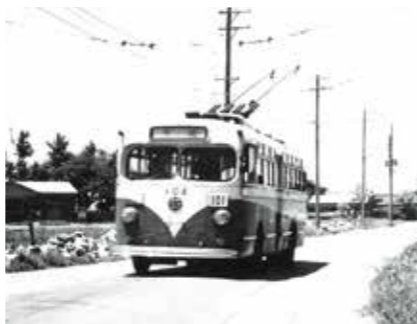
トロリーバス <今井付近>