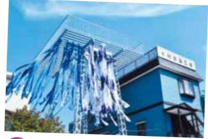
28 浴衣地たなびく 村井染工場

全長3kmの新川は江戸情緒あふれる街並みとして整備され、春には20種の桜が咲き誇ります。